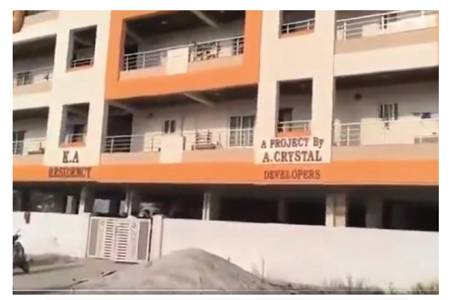
ఆరంభం భవనం కూల్చివేసిన హైద్రా..