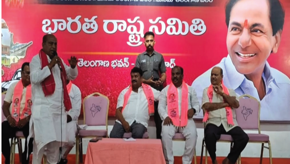
లా నిర్మాణం, డ్రైనేజీ సమస్యల పరిష్కారం వంటి అనేక కార్యక్రమాల చేసిన విషయాన్ని గుర్తు చేశారు. ఈ నెల 24 వ తేదీ నుండి ప్రారంభం కానున్న ప్రత్యేక ఓటరు సవరణ కార్యక్రమంపై అప్రమత్తంగా ఉండా